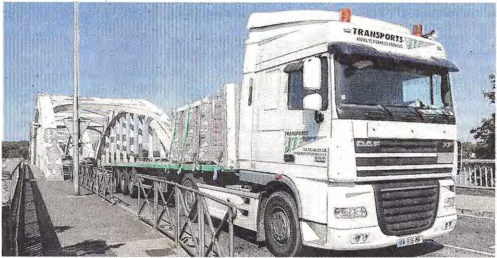
■ Le pont de Neuville est l'un des points noirs de la circulation dans le Val de Saône en période normale.

Sa mise en service est prévue pour fin 2017. Les automobilistes venant de Clermont-Ferrand ou de Genève et réalisant des liaisons d'est en ouest n'auront plus de raison de passer dans l'agglomération lyonnaise.