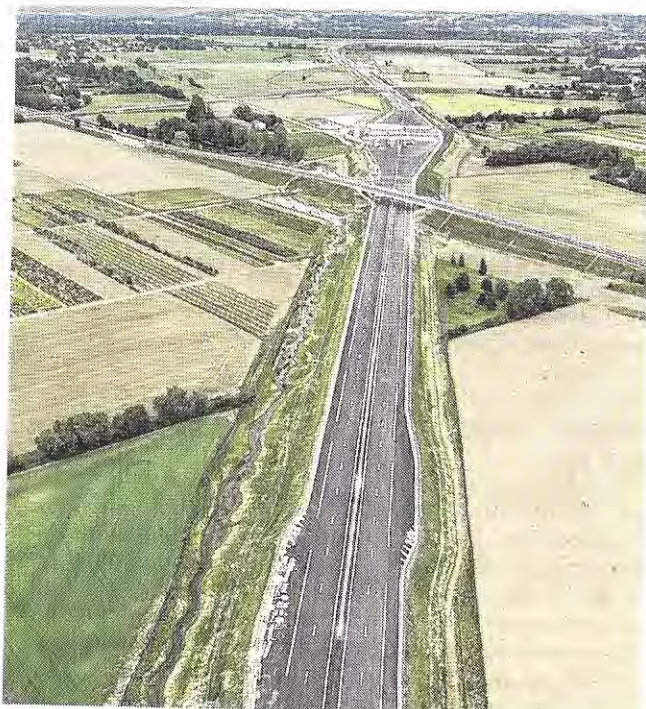
■ Le nouveau barreau autoroutier, nommé A466, est long de seulement 4 km.

(1) À noter que notre test a été effectué les 19 et 20 août, sous des conditions de circulation calmes et à des heures creuses.